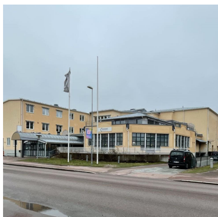
Kristinehamns Conference Center